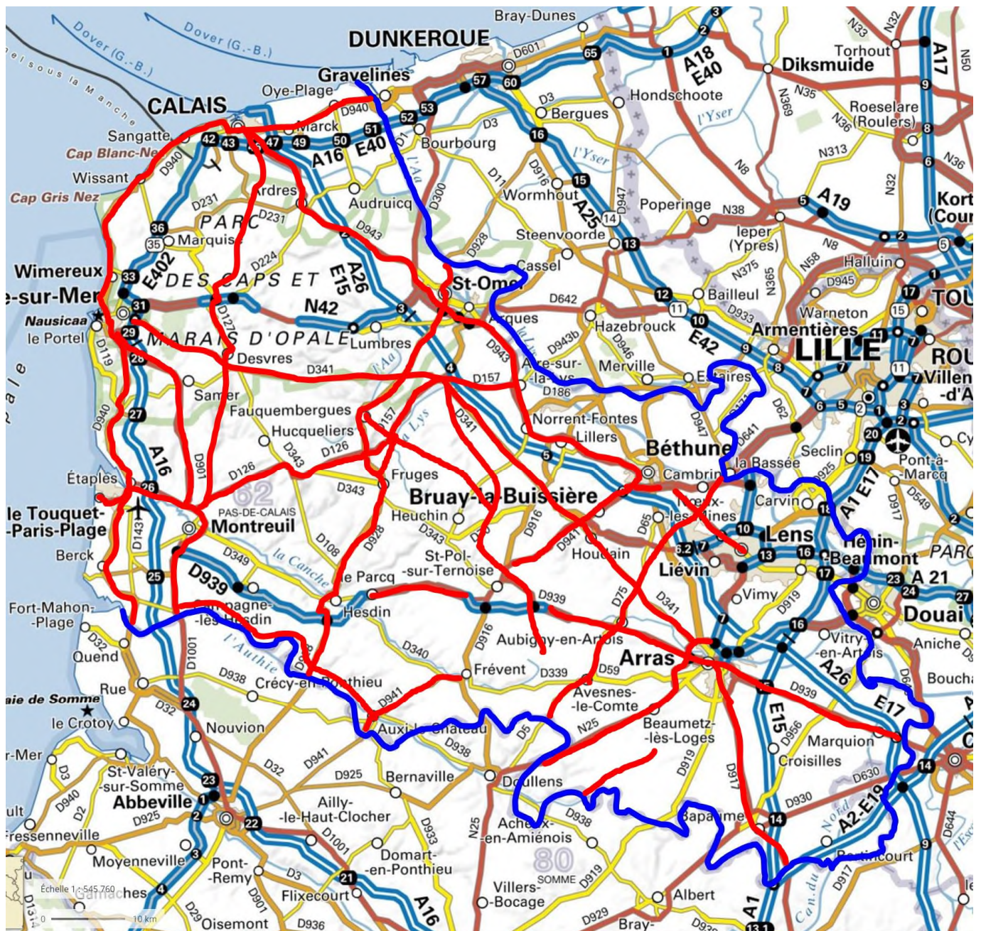
Carte des voies

Les 18 voies où ont été observés les plus grands nombres de tués, représentant seulement 13% de la longueur totale des routes sans séparateurs médian, concentrent 51% des tués.